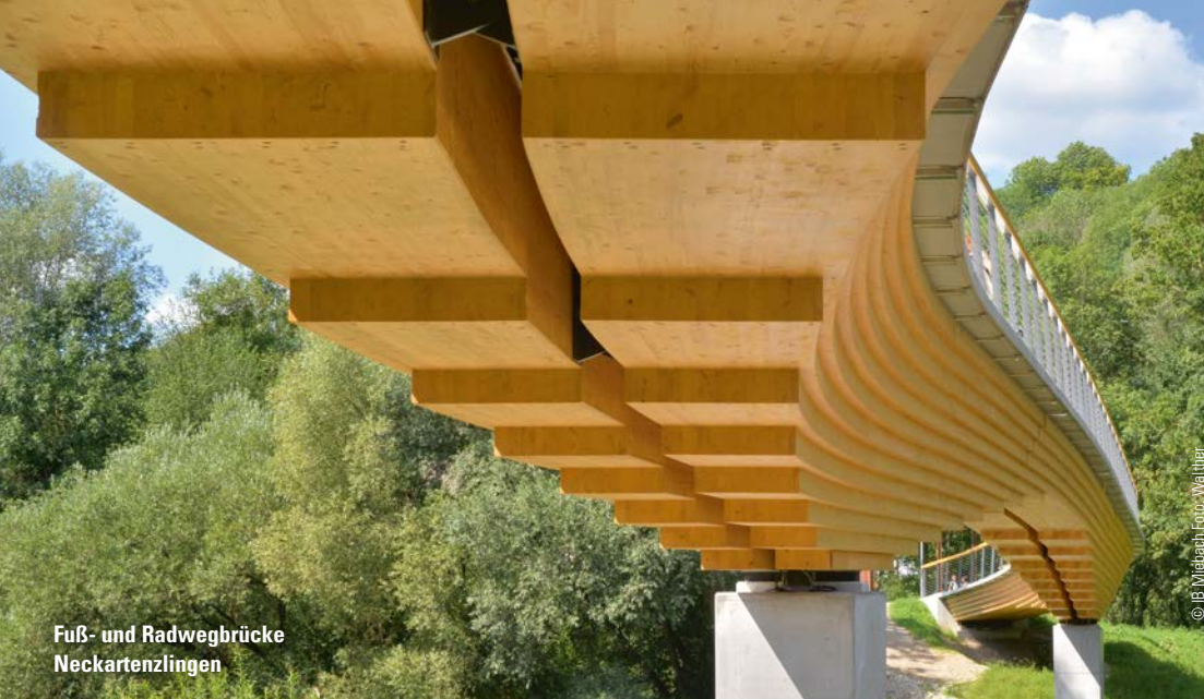
Fuß- und Radwegbrücke Neckartenzlingen