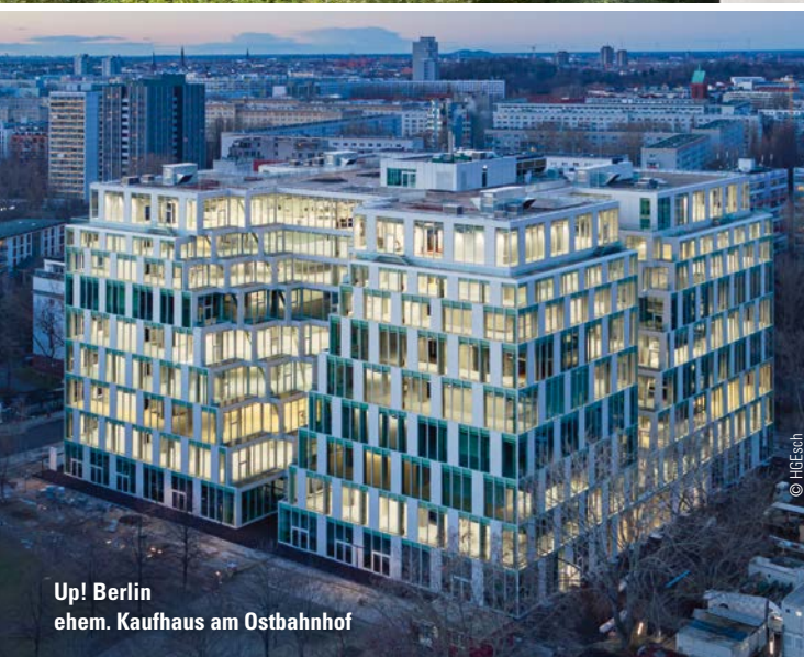
Up! Berlin ehem. Kaufhaus am Ostbahnhof